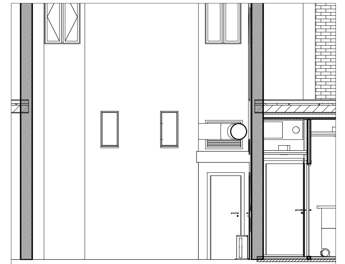
2 SECC. TRANS. PATIO ER.13 1:50